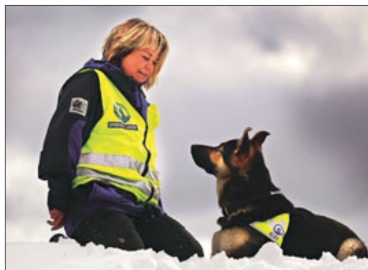
SAMSPILL: Det er ikke bare bikkja det kommer an på. Samarbeidet mellom fører og hund er avgjørende for å få fram en god redning-ekvipasje.

Tross all teknologi som finns. Ingen har funnet noe som kan konkurrere med hundens nese i ettersøkninger. Etter 50 år er Frost og hans kolleger fortsatt verdens mest effektive livreddere.