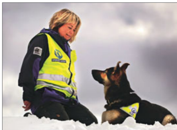
SAMSPILL: Det er ikke bare bikkja det kommer an på. Samarbeidet mellom fører og hund er avgjørende for å få fram en god redning-ekvipasje.